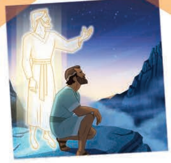
சிந்தனை சிற்றல்: ரெபேக்கா

தன் சகோதரனாகிய ஏசாவை இரண்டு முறை ஏமாற்றி ஆசீர்வாதங்களை சுதந்தரித்துக் கொண்டதால், ஏசா கோபங்கொண்டு யாக்கோபை பழிவாங்க நினைப்பதை அறிந்த ரெபேக்காள், ஏசாவின் கைக்கு தப்புவிக்க, பதான் ஆராமிலிருக்கிற அவன் மாமன் வீட்டிற்கு அனுப்பி வைத்தாள். யாக்கோபு பெற்றோரைப் பிரிந்து, இளம் வயதில் பதான் ஆராமிற்கு தனித்து போய், அறியாத தேசத்தில் தனிமையில் விடப்பட்டான். அநேக வருடங்களுக்குப் பிறகு தனது குடும்பம், சொத்துக்களுடன் தன் சொந்த தேசத்திற்கு திரும்பி வருகிறான். இப்பொழுதும் தன் சகோதரன் தன்னுடன் கோபமாக இருப்பான் என்று பயந்த யாக்கோபு, தன்னை எதிர்கொண்டு வரும் ஏசாவுக்காக பல பரிசுகளை அனுப்பினான். இராத்திரியில் தன் குடும்பத்தை யாப்போக்கு என்ற ஆற்றை கடக்கப்பண்ணி அக்கரைப்படுத்தினான். யாக்கோபு இக்கரையில் தனித்திருந்தான். ஏசாவுக்கு பயந்து தனித்திருந்த போது, நீர் என்னை ஆசீர்வதித்தாலொழிய உம்மை போகவிடேன் என்று இராமுழுதும் விழித்திருந்து ஜெபித்தான். கர்த்தர் அவனின் விடாப்பிடியான ஜெபத்தை கேட்டு யாக்கோபை இஸ்ரவேலாக ஆசீர்வதித்தார். அந்த ஜெபத்தின் விளைவாக ஏசா எதிர்கொண்டு வந்து அவனைத் தழுவி முத்தம் செய்தான். யாக்கோபு தனிமையில் ஆண்டவரோடு போராடி ஆசீர்வாதத்தைப் பெற்றான் (ஆதி. 32, 33).