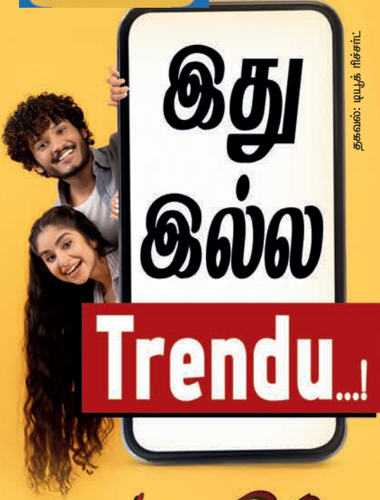
தகவல்: டியூட் ரிச்சர்ட்