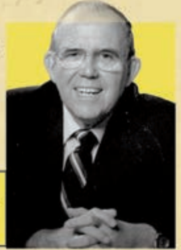
ஒரு : மூலாளர் யுவராஜ்