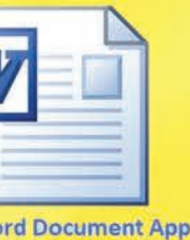
Word Document App

ಅರ್ಧಕ್ಕೆ ಬಿಟ್ಟ ಕೆಲಸವನ್ನು ಮರುದಿನ ಮಾತ್ರ ಪುನರಾರಂಭಿಸಬಹುದು. ಕ್ಲೌಡ್ ಸಂಗ್ರಹಣೆಯು ವರ್ಡ್ ಡಾಕ್ಯುಮೆಂಟ್ ಅಪ್ಲಿಕೇಶನ್ ಪರಿಹಾರವನ್ನು ನೀಡುತ್ತದೆ ಎಕ್ಸೆಲ್ ಅಪ್ಲಿಕೇಶನ್ ಈ ಸಮಸ್ಯೆಗಳು. ಪಠ್ಯದ ವಸ್ತುಗಳನ್ನು