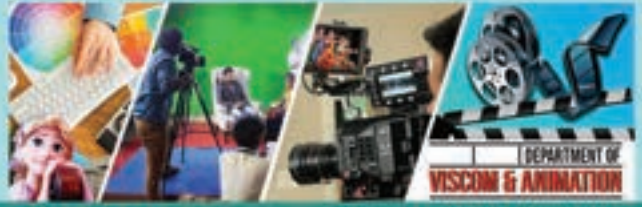
DEPARTMENT OF VISCOM & ANIMATION

ನಿಮ್ಮ ಪೋಷಕರೊಂದಿಗೆ ನಿಮ್ಮ ಆಕಾಂಕ್ಷೆಗಳ ಬಗ್ಗೆ ಮಾತನಾಡುವಾಗ, ಅದನ್ನು ಶಾಂತವಾಗಿ ಮತ್ತು ತಾಳ್ಮೆಯಿಂದ ಮಾಡಿ. ನಿಮ್ಮ ಶೈಕ್ಷಣಿಕ ಸಾಮರ್ಥ್ಯ ಮತ್ತು ಹೋರಾಟಗಳನ್ನು ಪ್ರಾಮಾಣಿಕತೆಯಿಂದ ಹಂಚಿಕೊಳ್ಳಿ. ನಿಮ್ಮ ಆಸಕ್ತಿಗಳು