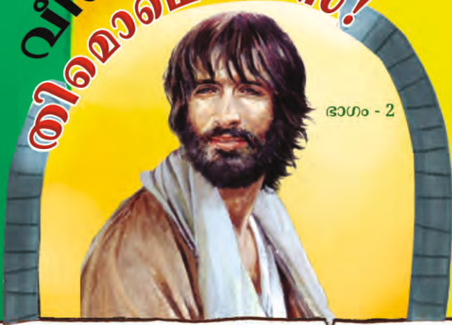
ഭാഗം - 2