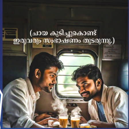
(ചായ കുടിച്ചുകൊണ്ട് ഇരുവരും സംഭാഷണം തുടരുന്നു.)